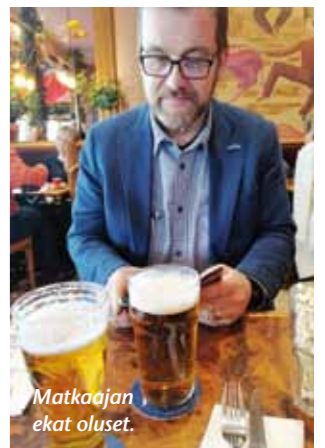
Matkaajan ekat oluset.