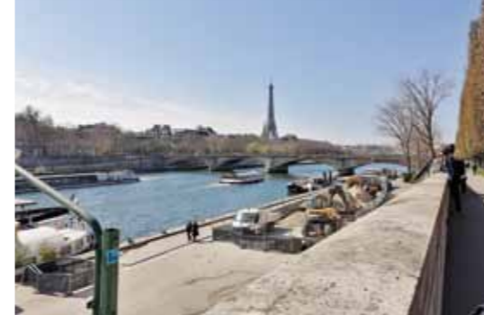
Seine ja Eiffel, Pariisin kevät.