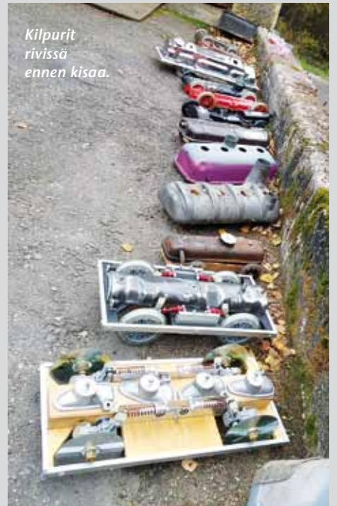
Kilpurit rivissä ennen kisaä.