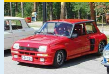
2007, Luumäki, Timo Klemola, R5 Turbo2