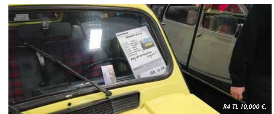
R4 TL 10,000 €.