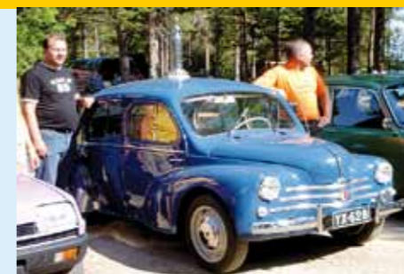
2005, Ranua, Seppo Kivelä, 4CV