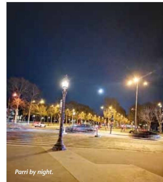
Parri by night.