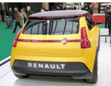
R5 electric prototyyppi.

Lauantai-aamun aloitimme läheisen brasserien aamiaisella ja lähdimme täpötäydellä vatsalla ja metrolla kymmeneksi avautuvaan näyttelyyn Porte de Versaillesin messukeskukseen. Siellä oli muutama