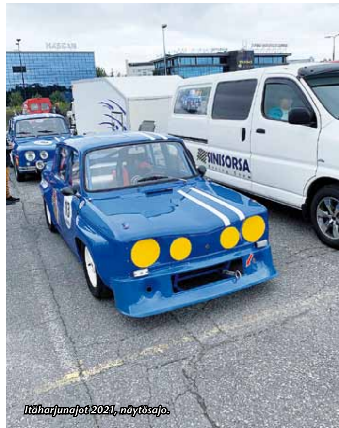
Itäharjunajot 2021, näytösajo.

Näitä on tehty 3 kpl Kerolan pajalla Kalajoella, joista