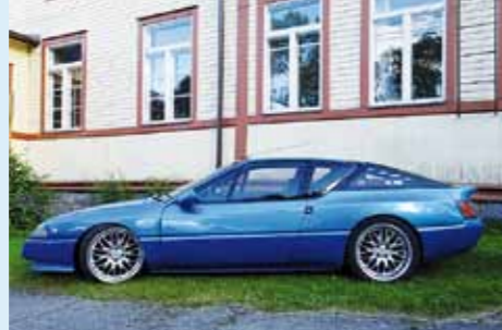
2017, Tarttila, Jukka Kätevä, Alpine V6 Turbo