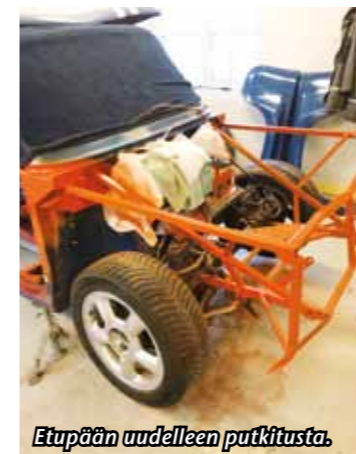
Etupään uudelleen putkitusta.