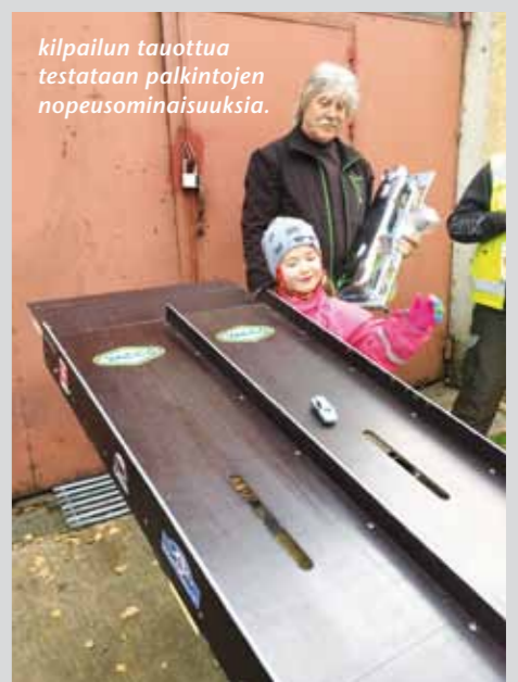
kilpailun tauottua testataan palkintojen nopeusominaisuuksia.