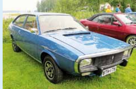
2016, Hauho, Timo Tuovinen, R15 TS Coupe Aut.