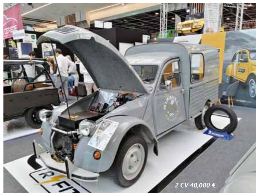
2 CV 40,000 €.