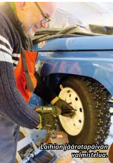
Laihtien jääratapäivän valmistelua.