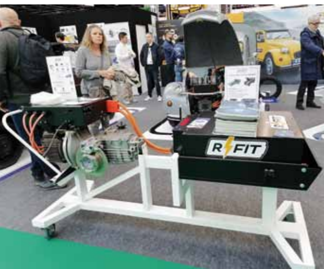
2 CV:n sähköinen voimalinja.