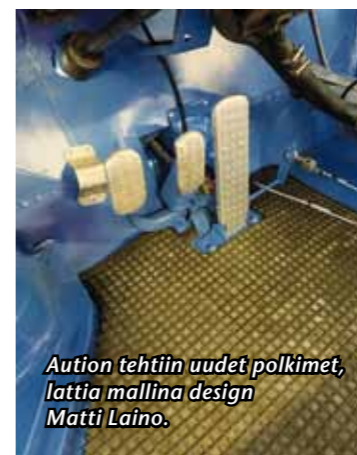
Aution tehtiin uudet polkimet, lattia mallina design Matti Laino.