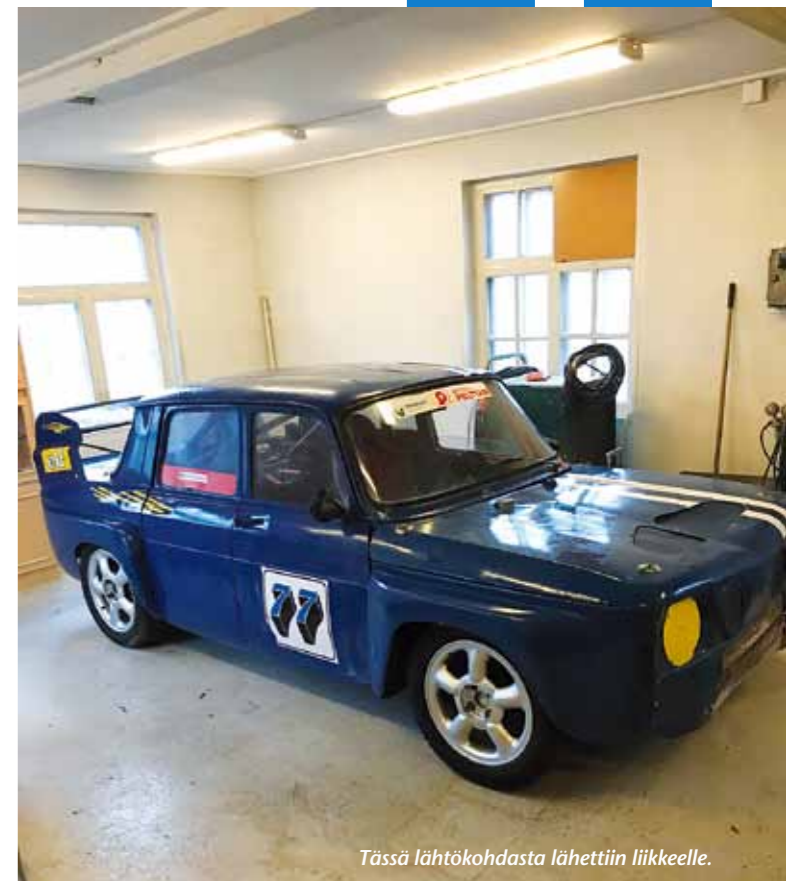
Tässä lähtökohdasta lähetettiin liikkeelle.