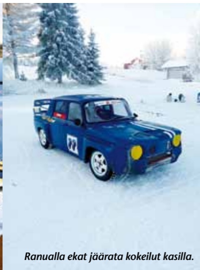
Ranualla ekat jäärata kokeilut kasilla.