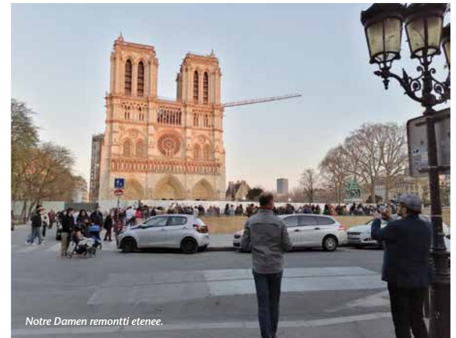
Notre Damen remonti etenee.