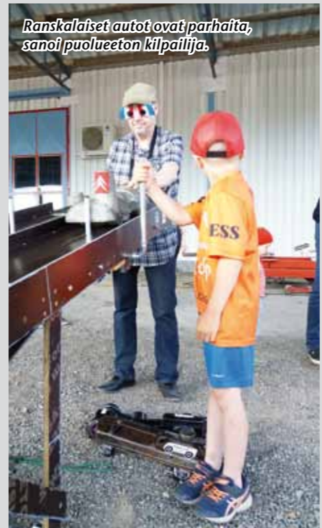
Ranskalaiset autot ovat parhaita, sanoii puolueeton kilpailija.

Koppa Cupissa kilpailtiin kesällä 2021 kolme osakilpailua. Ensimmäinen osakilpailu siirtyi Lahden Classic Motor shown peruuntumisen vuoksi ja se järjestettiin kesäkuusten alueellisten ranskalaiskokoontumisien yhteydessä Lahdessa. Toinen osakilpailu ajettiin peruuntuneen Viialan Vintage tapahtuman jälkeen syyskuisessa Viialassa järjestetyssä osakilpailussa ja kolmas osakilpailu Lokakuun Eka -tapahtumassa Vierumäellä.