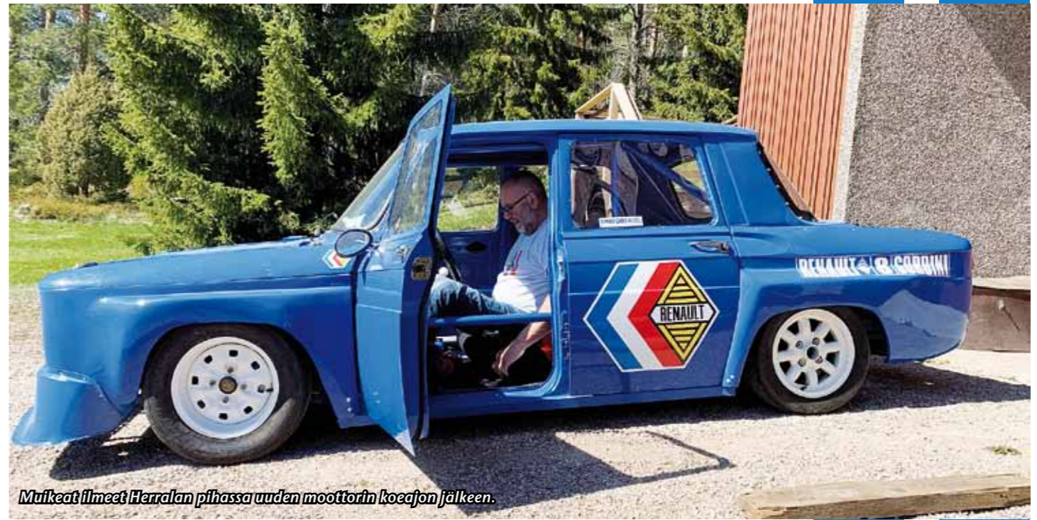
Muikemat ilmeet Herralan pihassa uuden moottorin koeajon jälkeen.

vi kilpaili autolla harvakseltaan kesäkuuhun 2002 saakka. 5-vaihteinen Gordinin vaihteisto rikkoitui Wasa Racewaysssa -98.