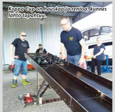
Koppa Cup on hauskaa ja rentoa, kunnes lähtö tapahtuu.