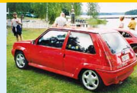
2003, Ellivuori, Jukka Kätevä, R5 GT Turbo