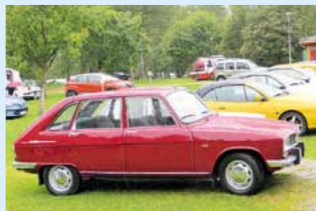
2015, Vaasa, Kimmo Penttilä, R16 TS