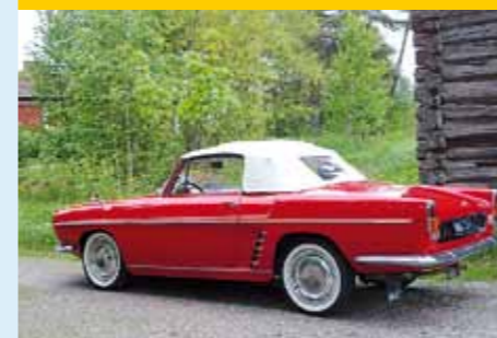
2010, Nummela, Jouni Peisalo, Floride