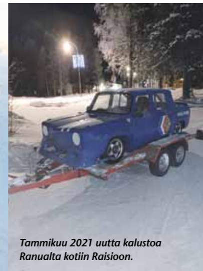
Tammikuu 2021 uutta kalustoa Ranualla kotiin Raisioon.