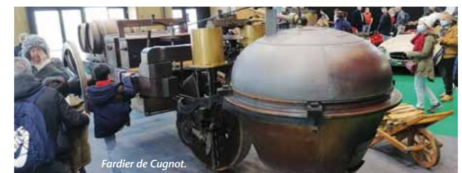
Fardier de Cugnot.