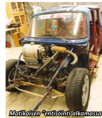
Matikaisen "entisöinti" alkamassa