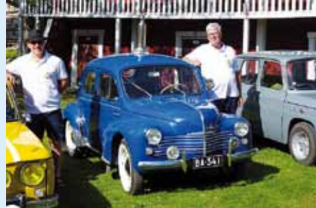
2019, Pyhäsalmi, Tauno Ala-Marttila, 4CV