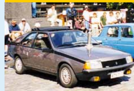
2001, Vaasa, Tarmo Tiainen, Fuego